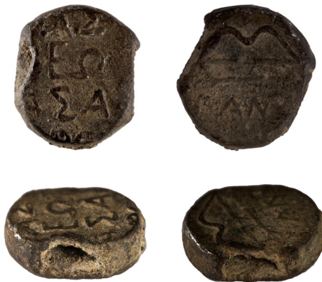
Илл. 1 Печать царя Асандра и властей Пантикапея из Херсонеса

Само же существование этого артефакта свидетельствует об активности контактов Херсонеса с Боспором при Асандре.